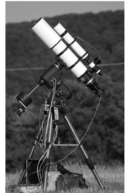
3. ábra. 130/780-as TMB refraktor EQ6 mechanikán

Mégis, milyen távcsövet vegyünk? Manapság nagy divatja van az ún. apokromatikus refraktoroknak , éles, kontrasztos, színhiba-mentes leképezésük és nagy kitakarásmentes (vignettálatlan) látómezőjük miatt. Sajnos azonban kevés az igazán fényerős modell, és általában nem tökéletesen korrigált a látómezőjük. A legtöbb apokromáthoz ezért képsík-korrektort kell használni, ami nem mindig egyszerű, hiszen nem minden cég gyárt ilyen lencsét távcsövéhez. Más gyártók korrektojai ugyan működhetnek jól, de erről csak tapasztalati úton tudunk meggyőződni. Esetleg az interneten találhatunk információt, vagy referenciaképet a megfelelő távcső-korrektor kombinációról. Sok gyártó a korrektort egyben fókuszreduktorral is kombinálja, amivel kicsit tovább növeli a fényerőt. Ha fotózásra szeretnénk használni a műszert, vásárlás előtt mindenképpen győződjünk meg arról, hogy szükséges-e hozzá korrektor lencse, és ha igen, pontosan milyen, kapható-e stb.