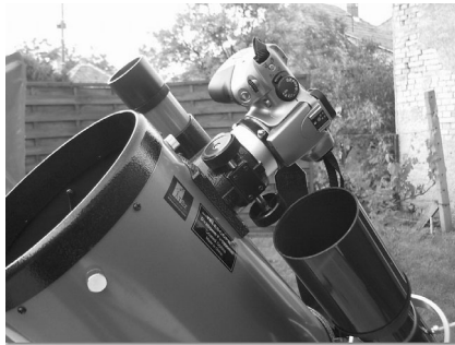
4. ábra. Digitális fényképezőgép egy 200/1000-es Newton-távcsövön

A mélyérfotózáshoz elengedhetetlen a jó minőségű, óragépes mechanika. Sajnos a legprecízebben kivitelezett távcsőállvány sem követ tökéletesen, aminek főleg mechanikai okai vannak. A legtöbb szerkezetben található csigaorsót és áttételeket szinte lehetetlen tökéletesen elkészíteni, ezért a követés pontatlan, az óragép hol picit késik, hol pedig siet. Ennek az ún. periodikus hibának a mértéke jellemzően a 30 és 5 ívmásodperc között mozog, de minőségi kategóriától függően előfordulnak ennél szélsőségesebb értékek is. Tehát ha pl. egy 135 mm-es teleobjektívvel elméletileg körülbelül 10–15"-es részleteket tudunk megörökíteni, akkor a mechanikának nem le-