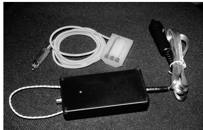
2. ábra. Házi készítésű külső táp.

A DSLR-ek saját akkumulátorról működnek, amellyel általában elég sok expozíciót lehet készíteni nappal. Éjszaka azonban ez nincs így. Hosszú záridejű felvételeknél a gép sajnos folyamatosan áramot vesz fel – típustól függően néhány száz milliampert óránként –, ezért a saját eleme gyorsan lemerül, főleg hideg, téli éjszakán. Be lehet szerezni külső tápellátást (pl. 12 V-os akkumulátor, l. 2. ábra), amellyel működtethetőek a kamerák. Így már egy kisebb kapacitású zselés akkumulátorral is több éjszakán keresztül fotózhatunk. Ez a teljesen manuális filmes kamerákhoz képest nyűg ugyan, mégis sokkal kényelmesebb, mint egy több amper fogyasztó nagy csillagászati CCD és a hozzá szükséges számítógép.