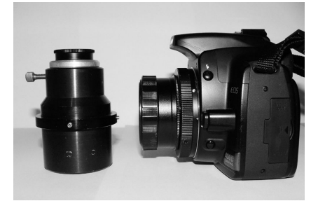
5. ábra. Parafokalizált élesítő toldat

Ilyenkor a gép helyére a toldatot tesszük, avval élesítünk, majd rögzítjük a fókuszálót és feltesszük a kamerát. Ezt a parafokalizálót úgy kell beállítani,